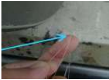
Gambar 2. Benang lengket