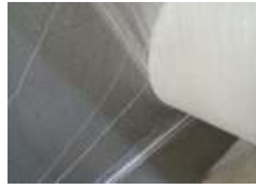
Gambar 3. Pinggiran beam jepit